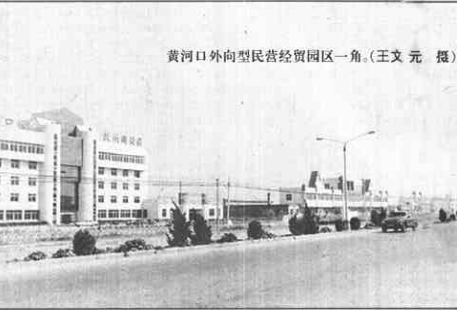
基础设施配套 投资环境优越

——优化环境促发展。发展民营经济，政策引导、利益驱动是关键，硬件“建设是基础”“软环境”方面，县委、县政府相继出台了《关于大力发展民营经济若干问题的决定》等一系列优惠政策，对民营企业